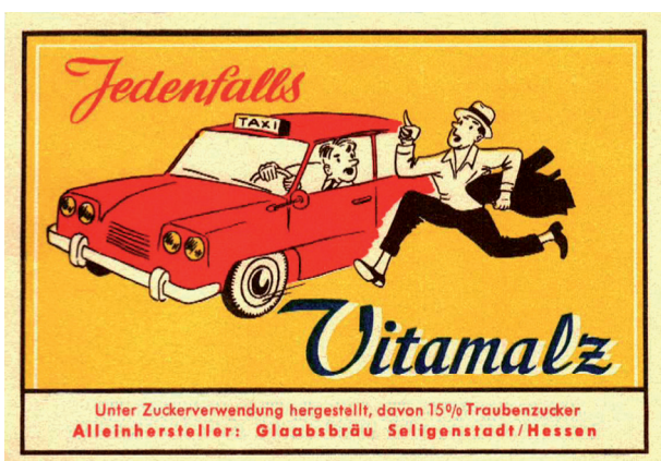
In Seligenstadt/Hessen war die Brauerei Glaabsbräu 1966 der Überzeugung, mit Vitamalz ein Taxi einholen zu können.