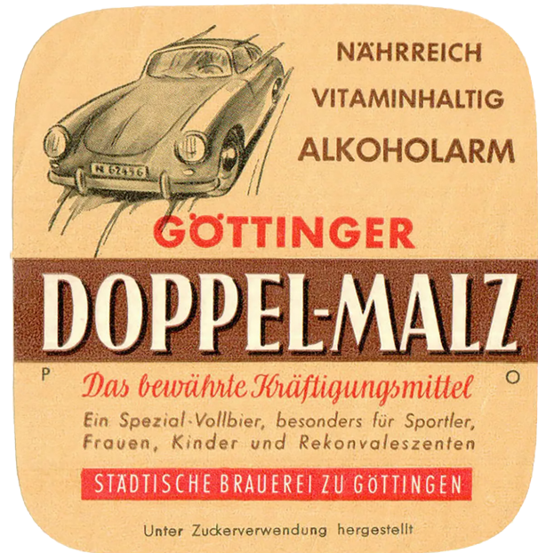
Die Brauerei in Göttingen bewarb 1962 ihr Doppel-Malz Bier mit einem Porsche 356 A Coupe.