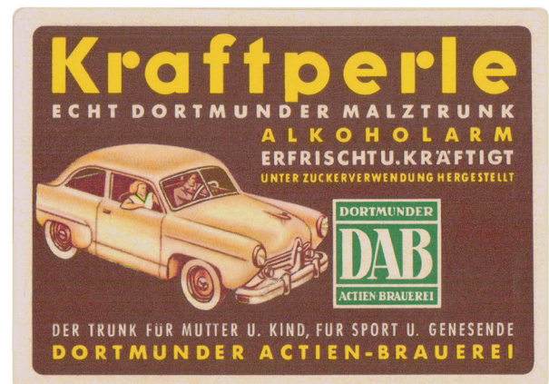
Nicht nur mit einem Strassenkreuzer (siehe Flaschenbild) sondern auch mit einem kleinerem Fantasie-Modell wurde 1961 für das Malz-Bier geworben.