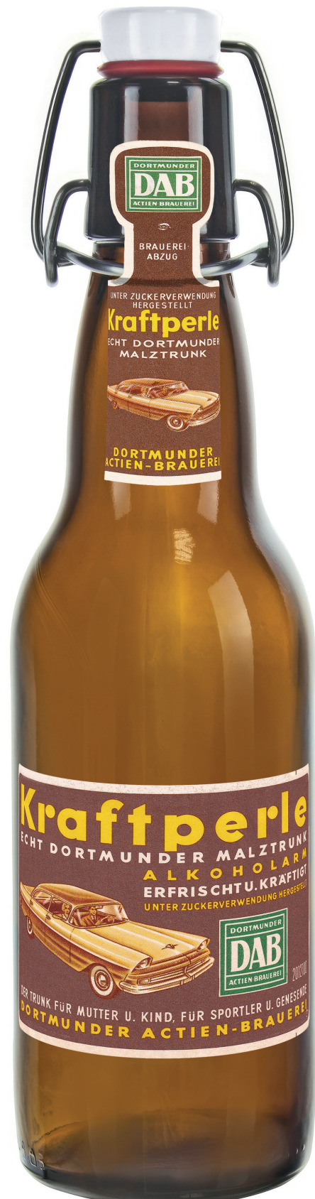
Die Dortmunder Aktien Brauerei bewarb 1961 ihr Malz-Bier als Kraftperle mit einem Fantasie-Strassenkreuzer.