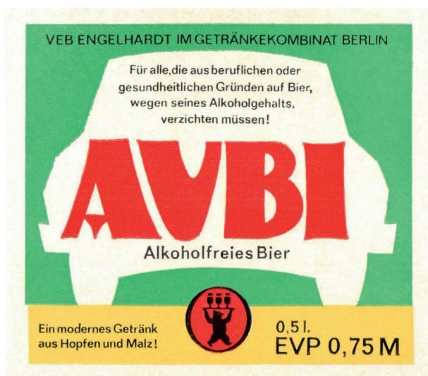
Das AUBI-Etikett von 1980 ist sehr schlicht gestaltet, jedoch ist sehr ausführlich der Sinn des alkoholfreien Bier erklärt.