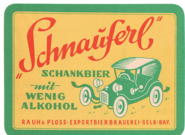
Im Jahr 1966 versuchte diese Brauerei in Bayern ihr Bier mit wenig Alkohol unter dem Namen "Schnäuferl" zu vermarkten.