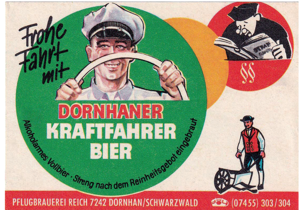
Die Dornhaner Brauerei bewarb 1964 ihr Getränk als Kraftfahrer-Bier mit einem lächelnden Autofahrer und einem verzweifelt im StGB suchenden Richter im Hintergrund.