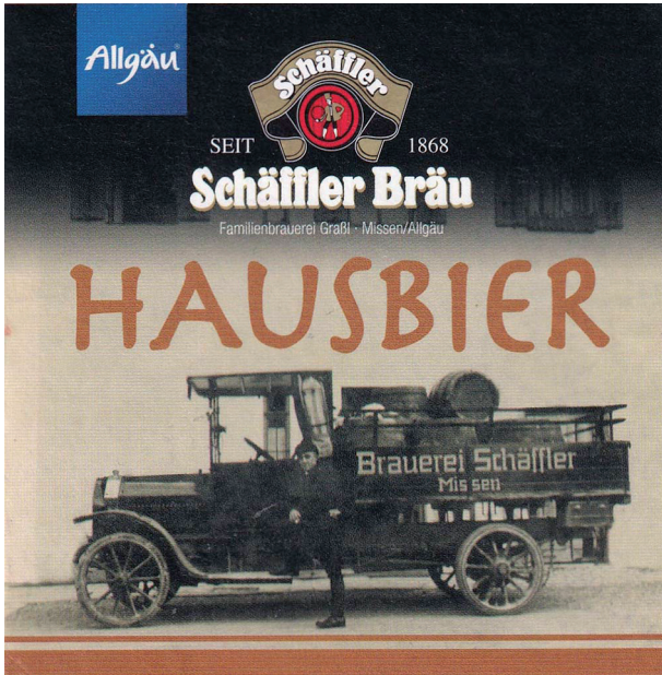
Die Brauerei Schöffler im Allgäu präsentiert ihren Lieferwagen aus einer Zeit, wo noch Vollgummireifen üblich waren.